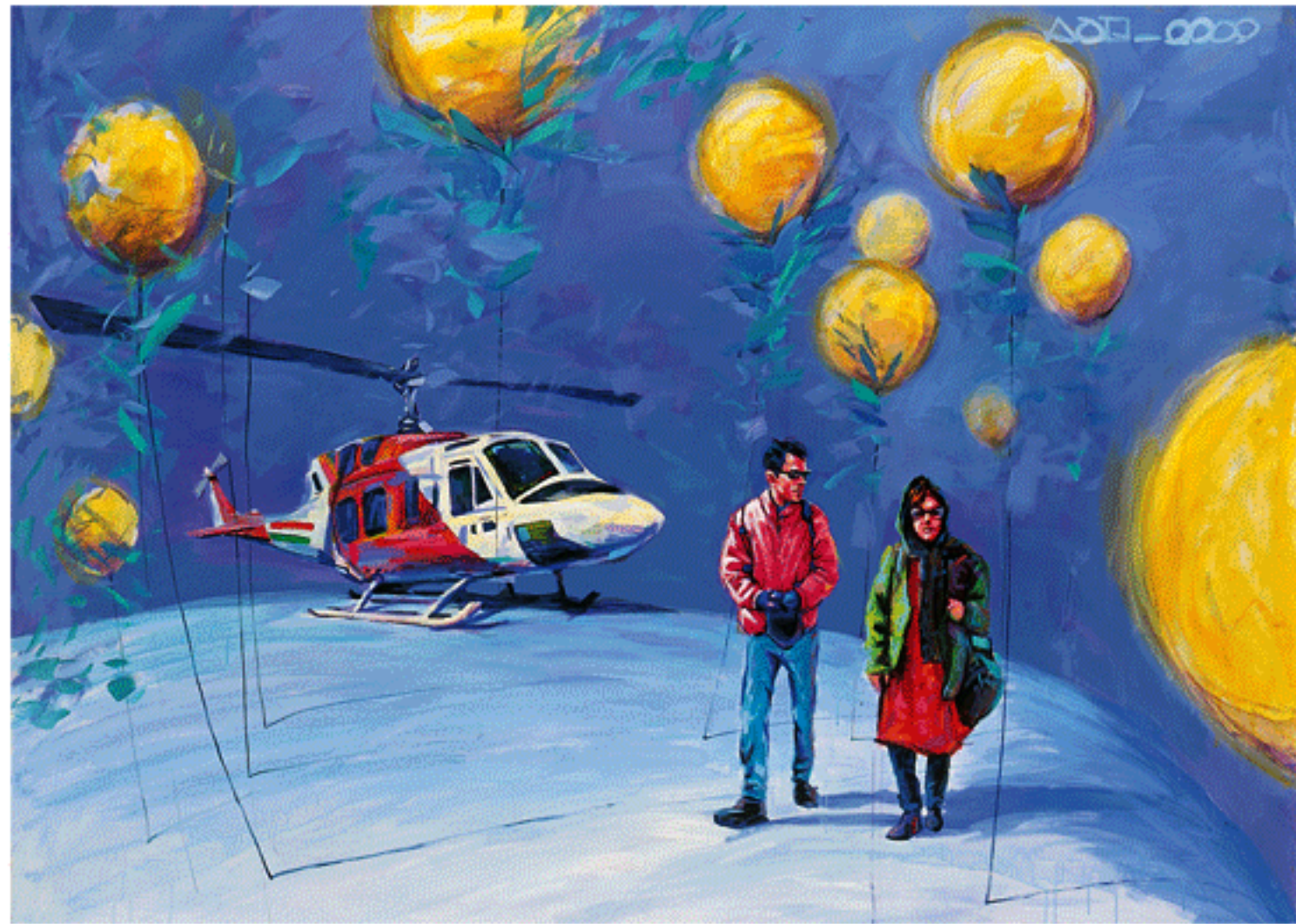
Acrylic on canvas, 150x200cm, 2009