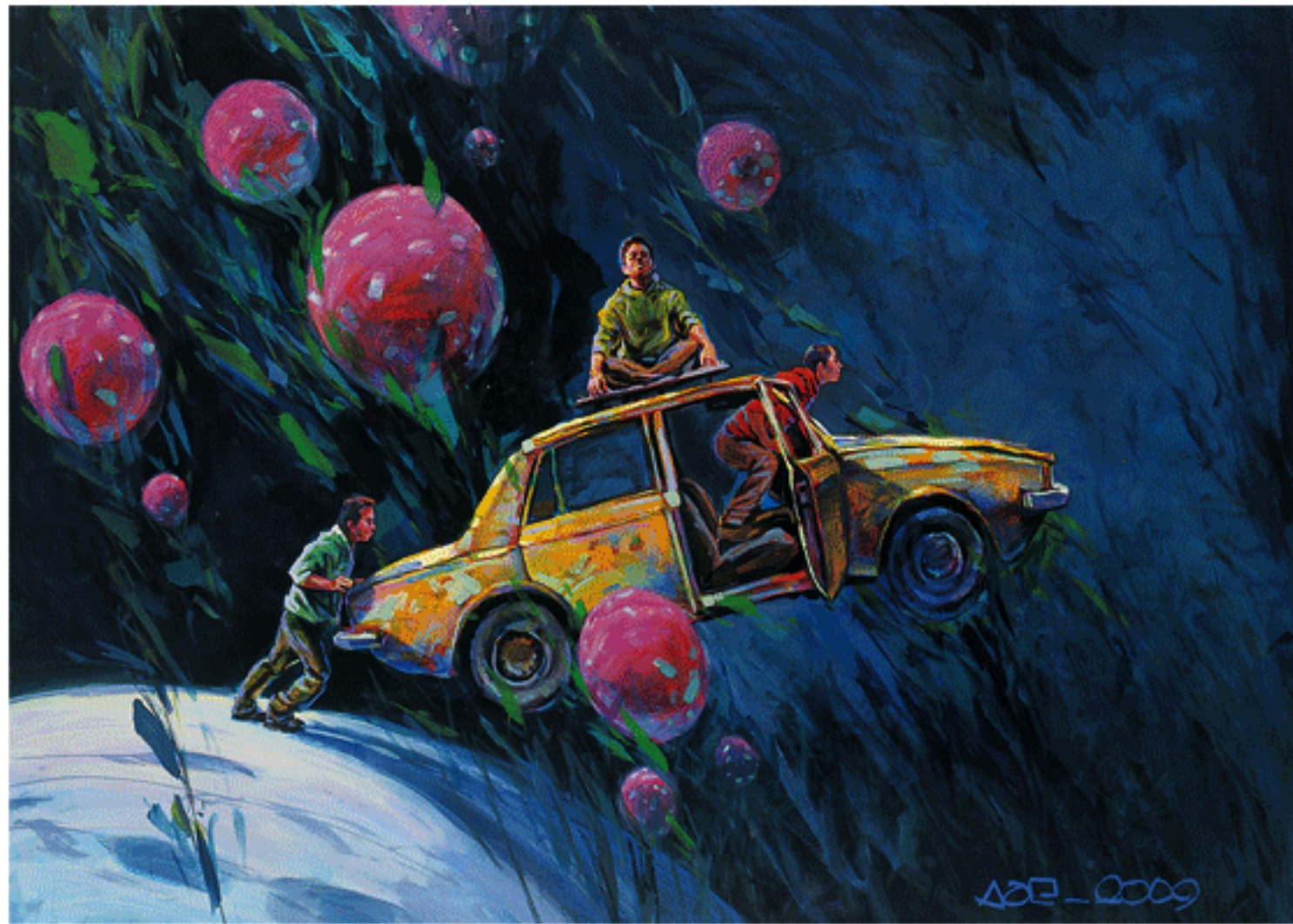
Acrylic on canvas, 150x200cm, 2009