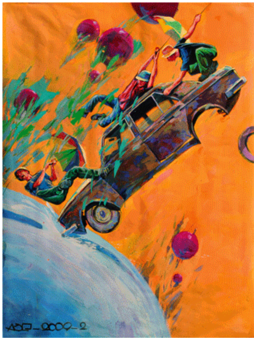
Acrylic on canvas, 200x300cm (diptych), 2009