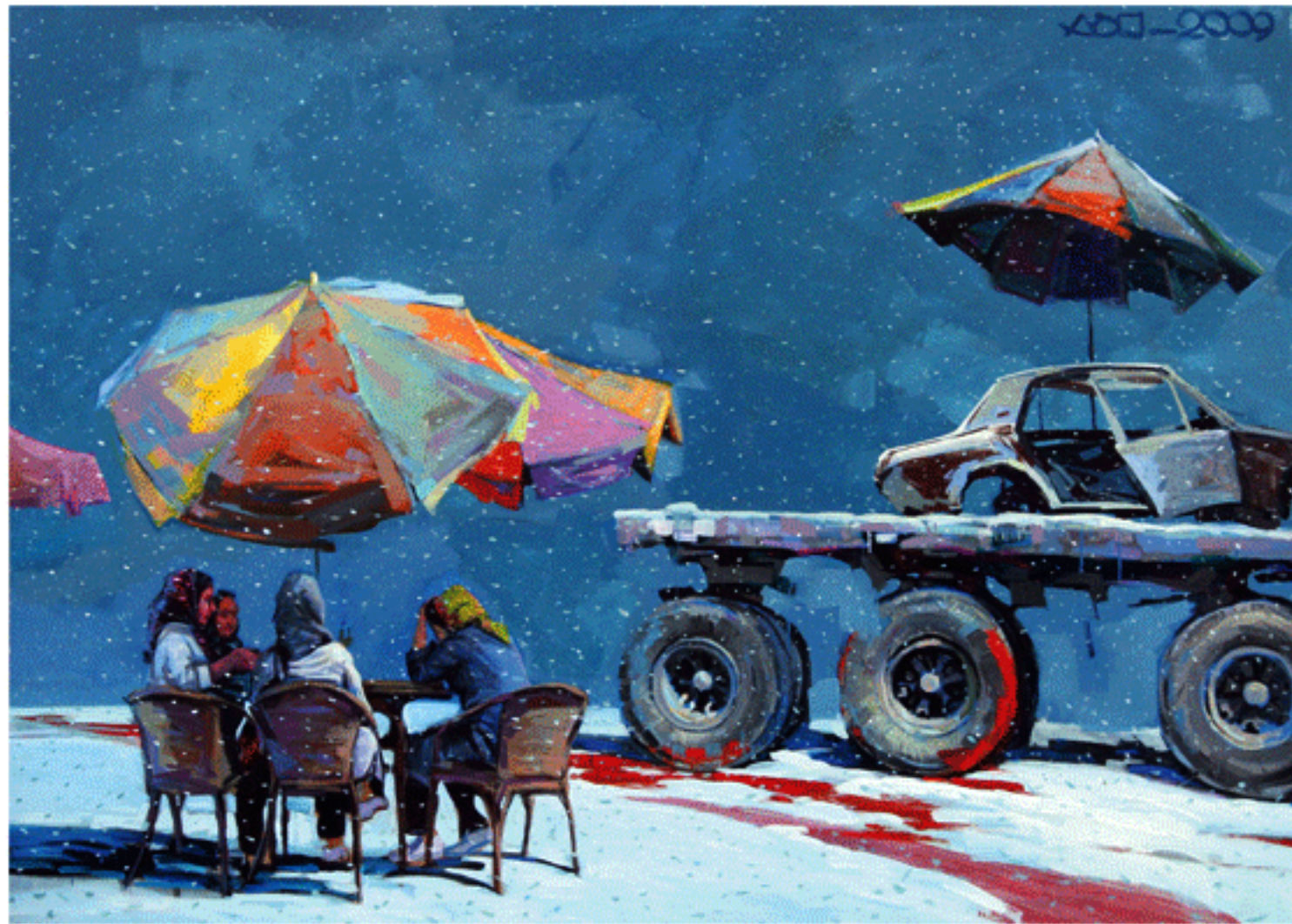
Acrylic on canvas, 150x200cm, 2008