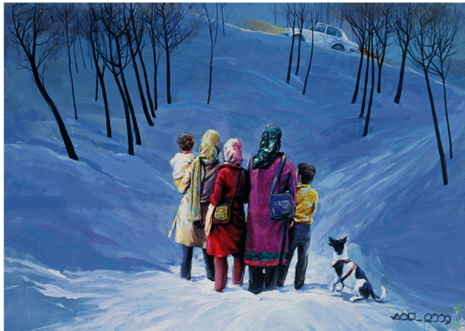
Acrylic on canvas, 150x200cm, 2009