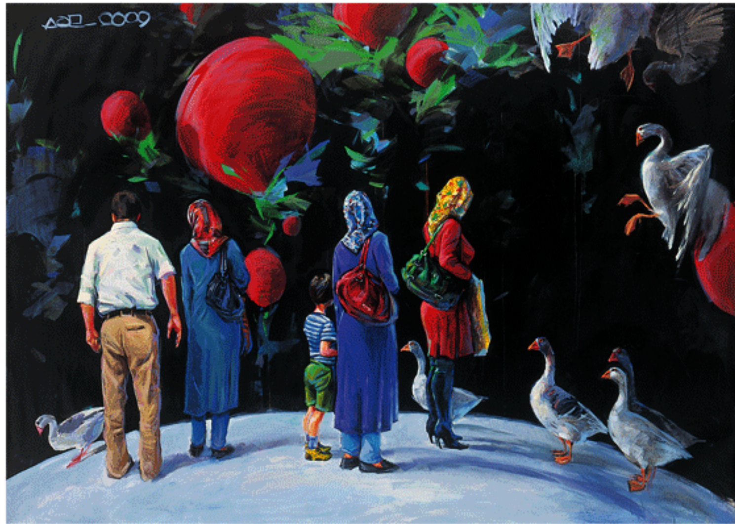
Acrylic on canvas, 150x200cm, 2009