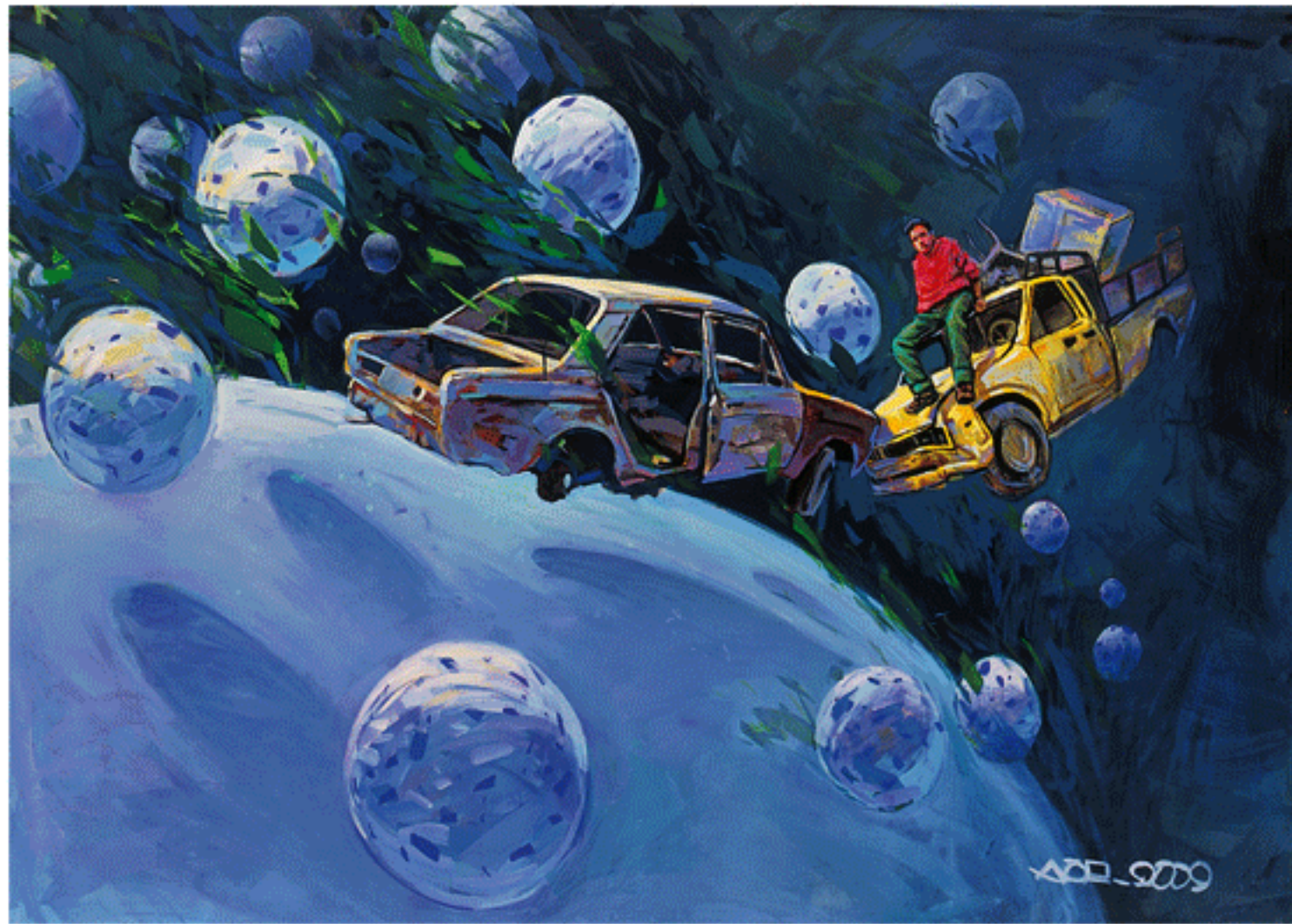
Acrylic on canvas, 150x200cm, 2009