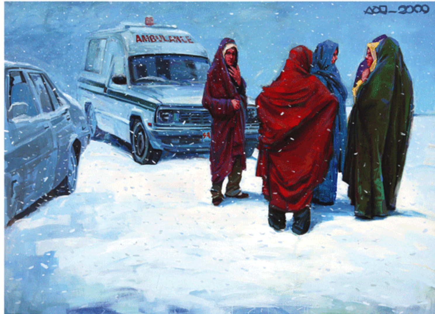
Acrylic on canvas, 150x200cm, 2009