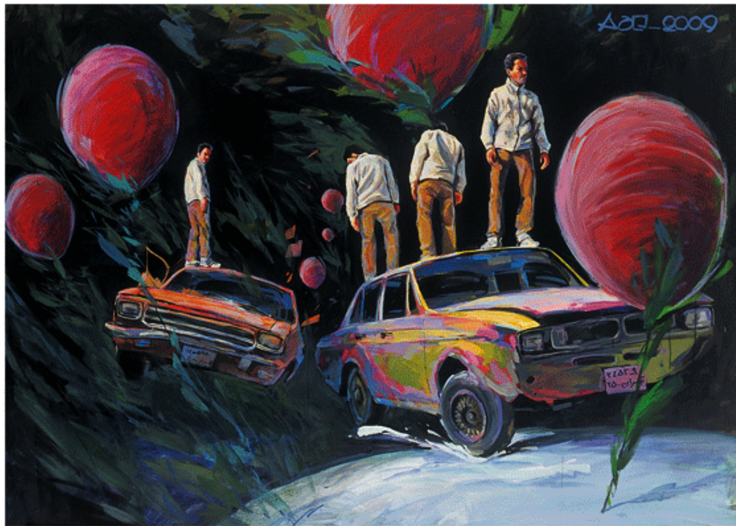
Acrylic on canvas, 150x200cm, 2009