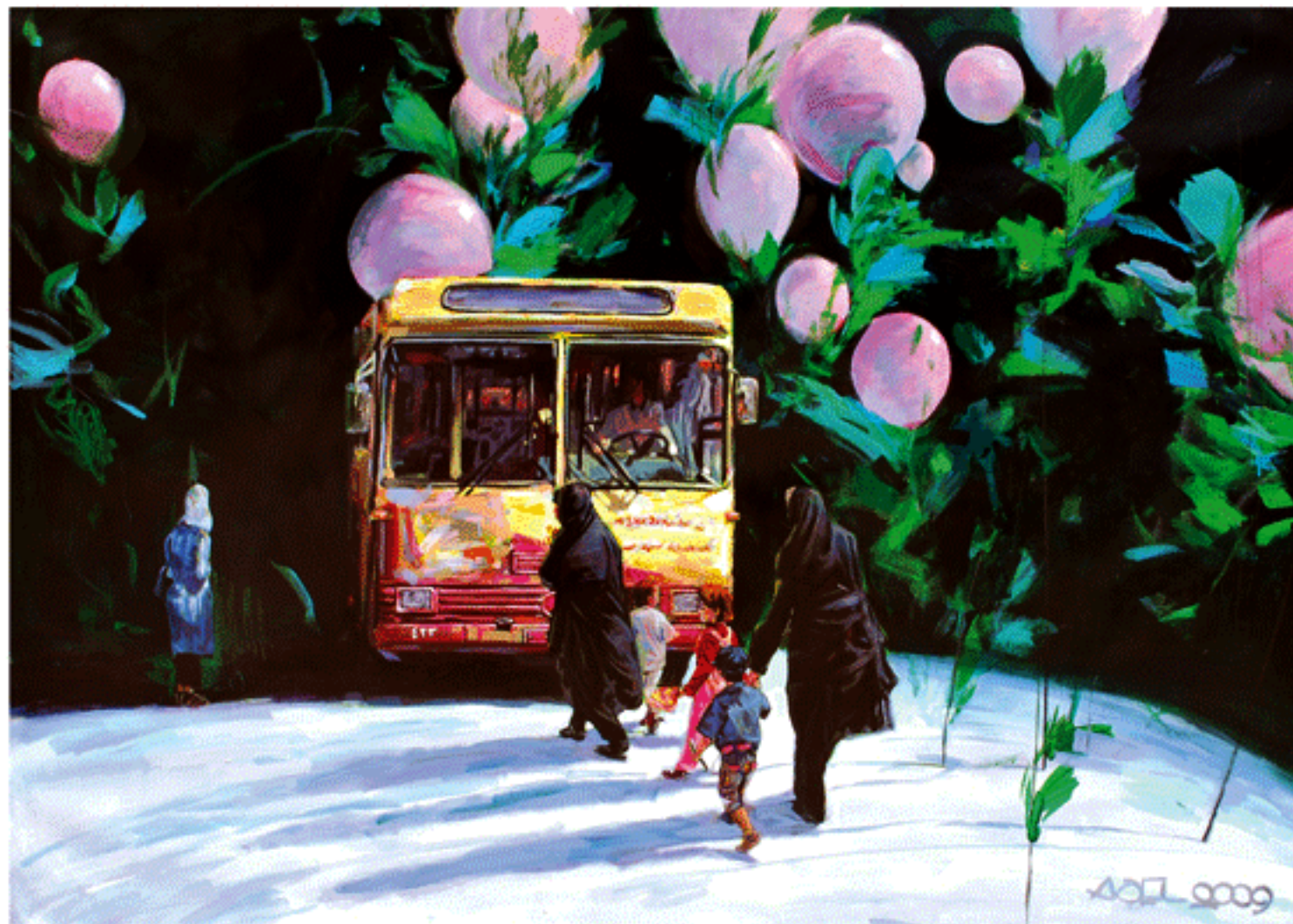
Acrylic on canvas, 150x200cm, 2009