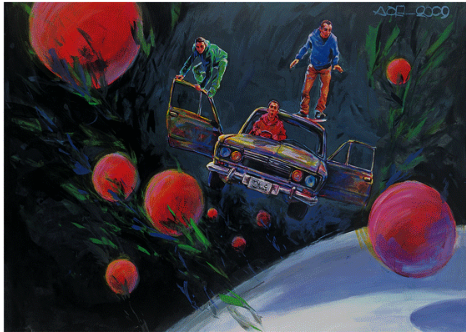
Acrylic on canvas, 150x200cm, 2009