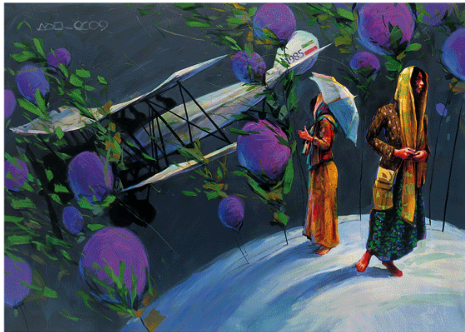
Acrylic on canvas, 150x200cm, 2009